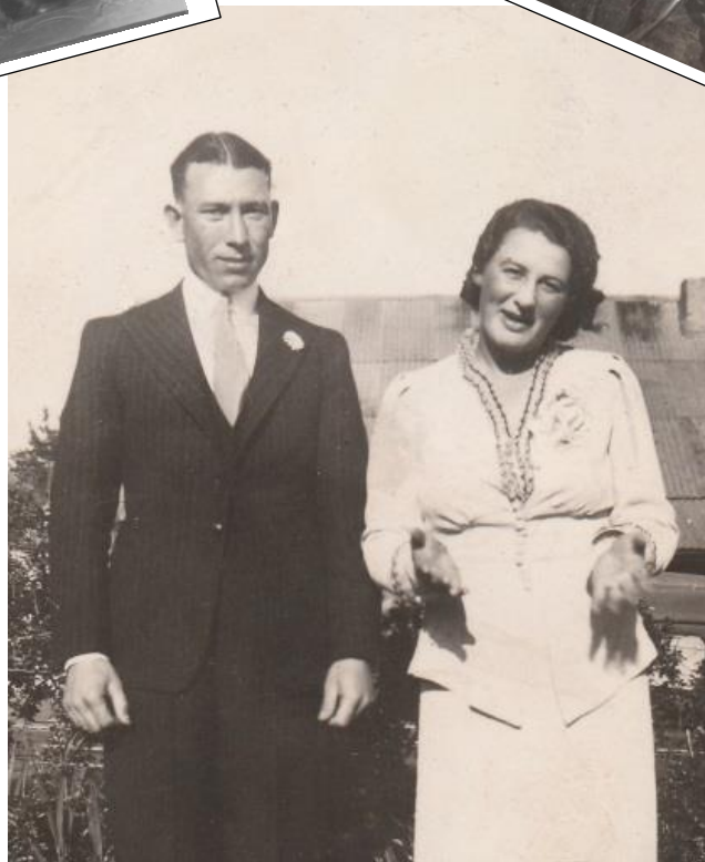
TROUÉ 1938 - GRABOUW